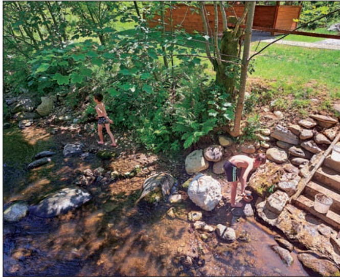
Nezabudnuteľné chvíle prežité pri potôčiku.

Prázdniny sú pre každého pracujúceho rodiča skúškou logistiky a manažérskych zručností. Sklíbiť prácu s plnohodnotným rodičovstvom totiž dokáže len kúzelník.