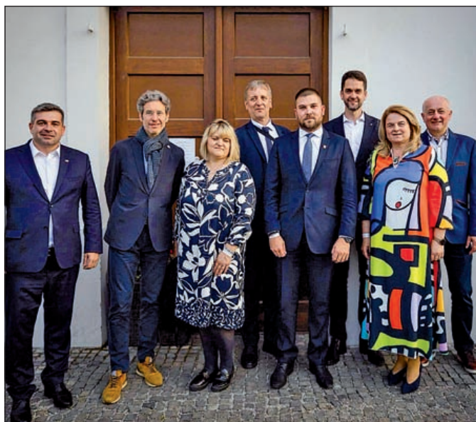
Aj hostia sa uzhdli, že Brezno prekvitá...