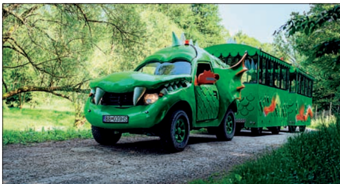
Drakovláčik ponúka zážitkové jazdy

Naša organizácia sa v tomto roku zúčastnila mnohých domácich i zahraničných veľtrhov, výstav a workshopov s cieľom odprezentovať čo najväčšiemu množstvu potenciálnych návštevníkov, ale i odbornej verejnosti pôsobiacej v oblasti cestovného ruchu, bohatú, no hlavne pestrú ponuku produktov a služieb nášho krásneho regiónu Horehronie. Ďalšie veľtrhy máme naplánované v období jesene a začiatkom zimnej sezóny, kde by sme tentokrát veľmi radi predstavili všetkým záujemcom naopak, ponuku zimných aktivít. V každom prípade ide o prestížnu formu prezentácie produktov a služieb cestovného ruchu, ktorá spája a zároveň prepája odborníkov a širokú verejnosť z oblasti cestovného ruchu, a to na medzinárodnej až svetovej úrovni. Táto forma poskytuje ideálnu príležitosť na nadviazanie nových obchodných kontaktov, utuženie existujúcich partnerstiev a prezentáciu turistických destinácií.