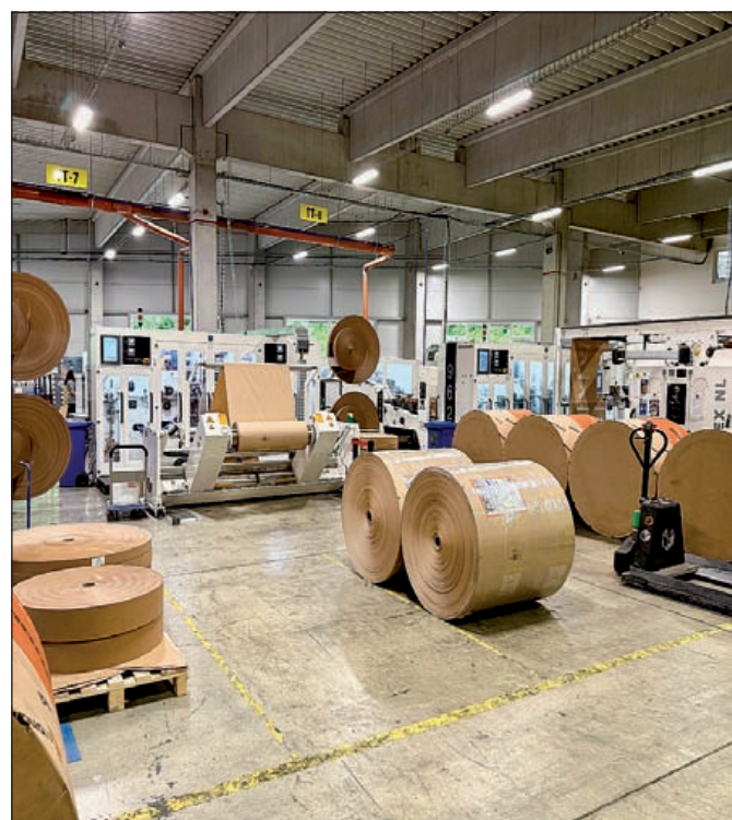
Pohľad na novú linku

lok v Európe. Harmanec-Kuvert prináša tak ďalšie pracovné miesta priamo do nášho regiónu, za čo sme nesmierne vďační. Aj táto investícia je jasným signálom, že Horehronie má čo ponúknuť. Že aj tu, v srdci Slovenska, sa dá rozvíjať priemysel, inovácie a najmä – dávať ľuďom prácu, ktorú si zaslúžia.