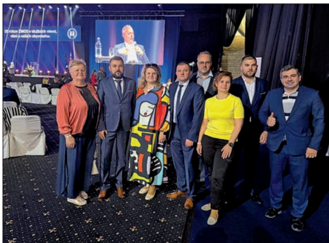
Účastníci snemu z nášho regiónu

Druhý deň snemu bol venovaný odborným panelovým diskusiám, zameraným na aktuálne výzvy a smerovanie miestnej samosprávy. Prvá diskusia s názvom „Quo vadis, samospráva? Cesta, ktorú sme prešli. Výzvy, ktoré nás čakajú“, ponúkla pohľad na vývoj územnej samosprávy od roku 1990, na súčasné výzvy a potrebu reštartu procesu decentralizácie. Diskusia bola venovaná aj postaveniu sa-