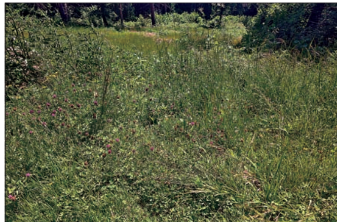
Pravidelné kosenie zabraňuje šíreniu burín a alergénov, ilustračné foto O. Kleinová

Kosenie vysokej buriny je nutné najmenej dva razy do roka, prípadne častejšie. Pokoste pozemok v čase pred kvitnutím burín na jar a druhýkrát na jeseň. Kosenie lúk, zanedba-